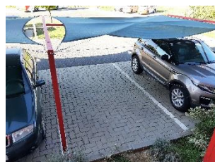
2. Kapu Sopron