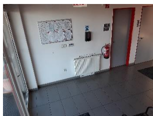
Főbejárat belső Sopron