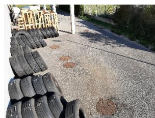
Hátsó tároló Sopron