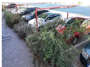
Főbejárat külső Sopron