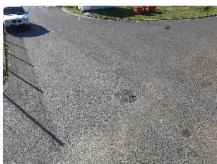
1. Kapu Sopron