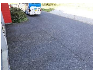
Műhely kijárat Sopron