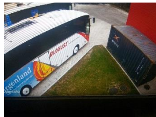
Hátsó parkoló Győr