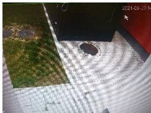
Hátsó bejárat Győr