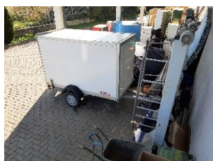
Üzemanyag kút Sopron